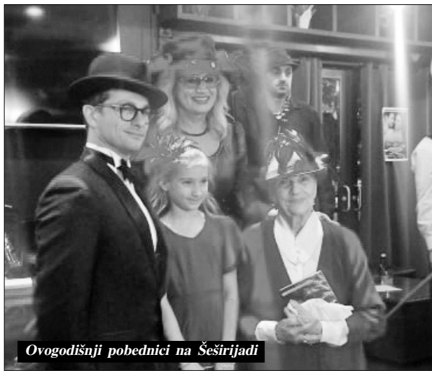
Ovogodišnji pobednici na Šeširijadi