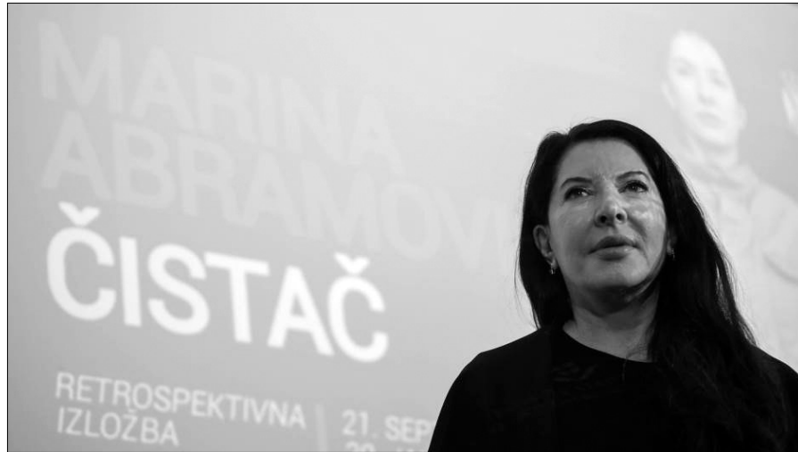
Retrospektiva Marine Abramović u Beogradu: