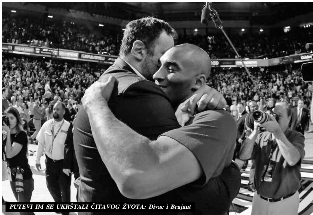
PUTEVI IM SE UKRŠTALI ČITAVOG ŽVOTA: Divac i Brajant

Do susreta dva asa dolazilo je više puta, a najčešće u trenucima kad je naš teniser