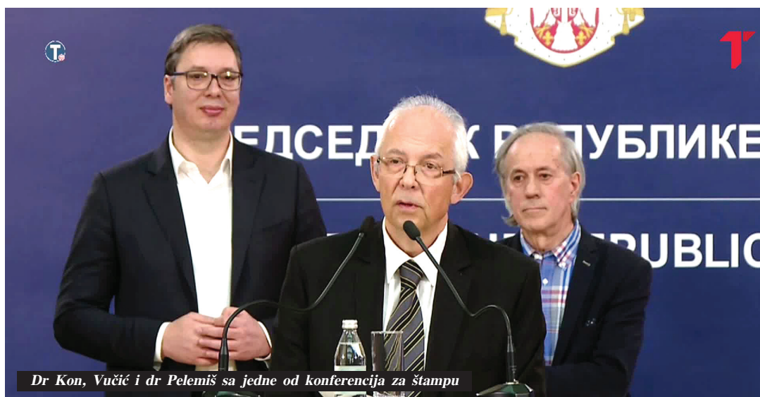
Dr. Kon, Vučić i dr. Pelemiš sa jedne od konferencija za štampu

Kisić Tepavčević je naime najpre na RTS rekla da je prva infekcija korona virusom izolovana 1. marta i da se dva dana posle toga dogodio i drugi slučaj. Izbori su raspisani 4. marta, a javnost je o prvom slučaju virusa obavestena 6. marta nakon što je vladajuća SNS već sakupila neophodne potpise za predaju liste tako što su ljudi masovno čekali zbijeni u redovima širom Srbije ispred odbora te stranke. Kesić Tepavčević se kasnije ispravila i navela da je prvi slučaj registrovan u prvoj nedelji marta, a predstavnici opozicije koja neće učestvovati na izborima smatraju da je na to naterana.